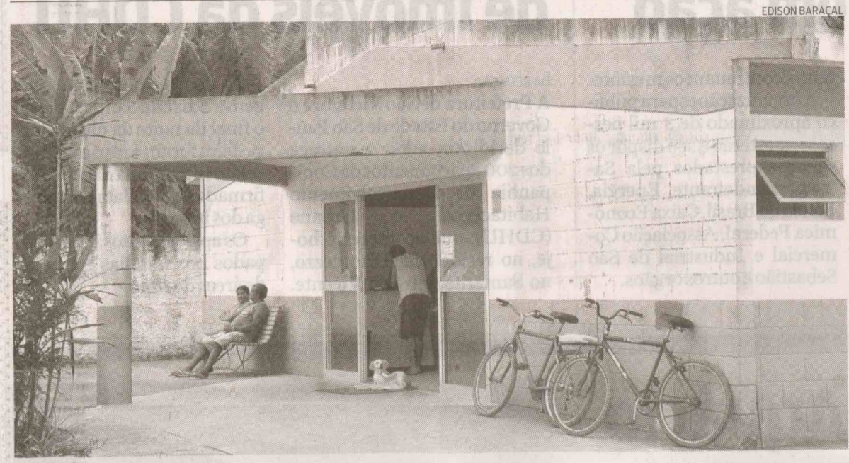
As informações de atendimento de crianças na rede municipal de saúde estarão interligadas e disponíveis