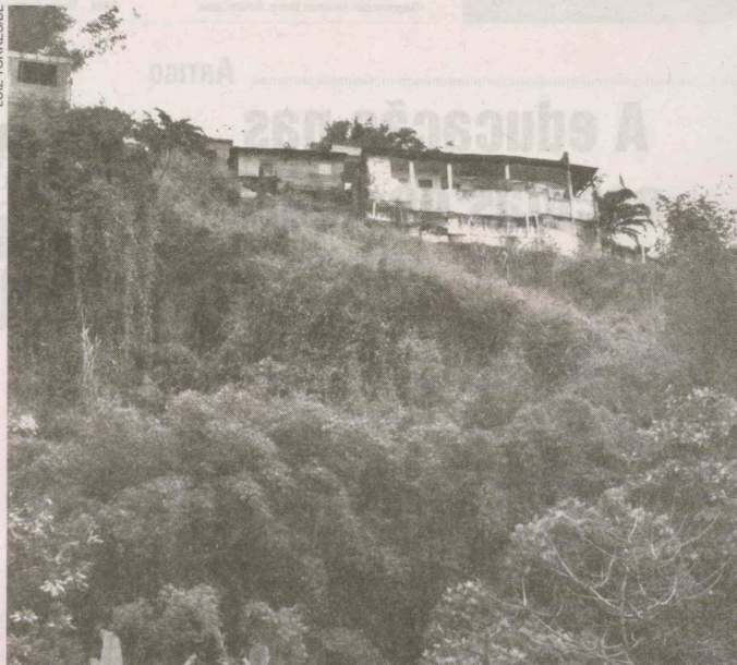
Nível da chuva é monitorado 24 horas por dia em prevenção a deslizamentos em áreas de risco